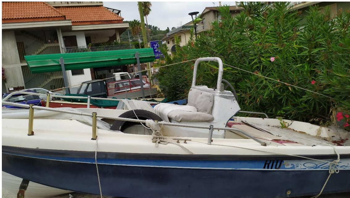
Bene n.5 (con motore fuoribordo Evinrude 521 cc)