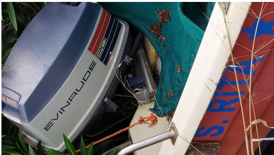
Bene n.8 (motore fuoribordo Evinrude 20 cv)